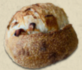
Figos secos _____ 20,5