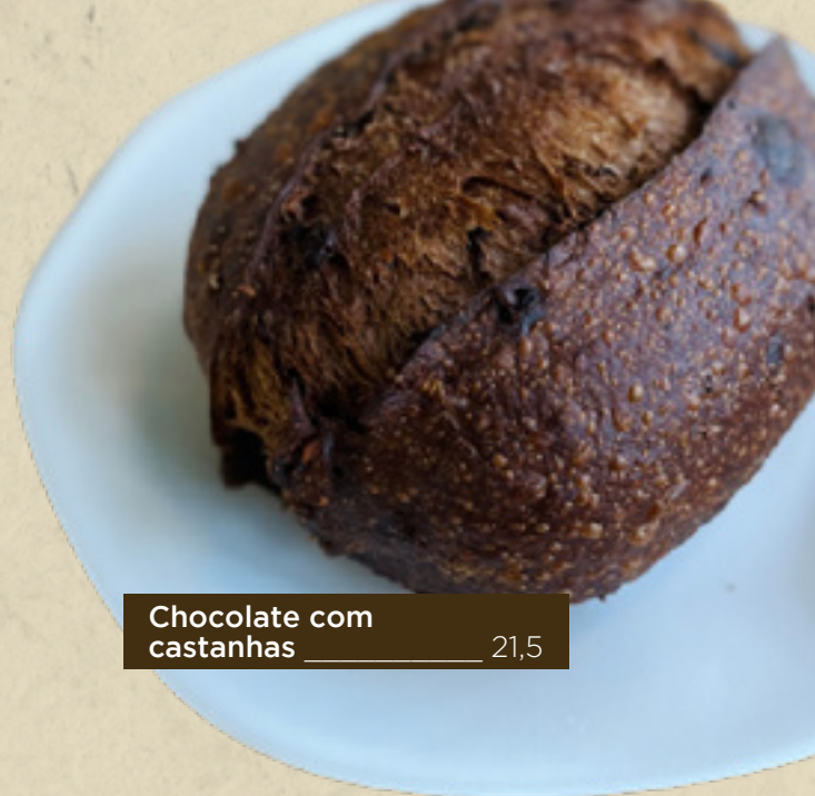
Chocolate com castanhas _____ 21,5