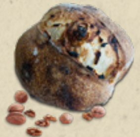
Damasco com nozes _____ 22