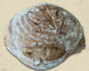
Cerveja com mostarda _____ 21,5