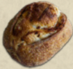
Linguica _____ 22