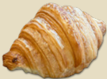
Croissant _____ 9,5