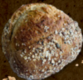
Multigrãos _____ 21,5