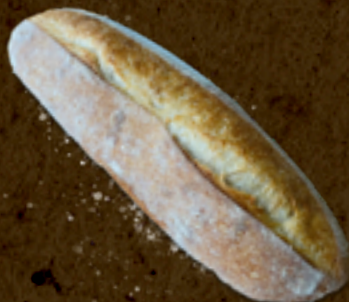
Italiano _____ 14