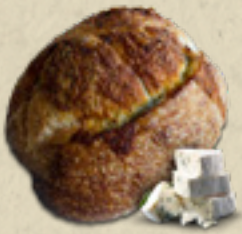
Gorgonzola _____ 22