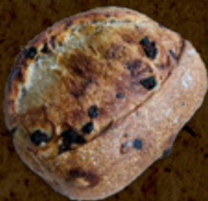
Uvas passas _____ 20