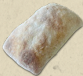
Ciabatta _____ 6,5