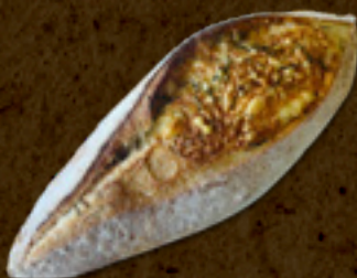
Parmesão com alecrim _____ 20