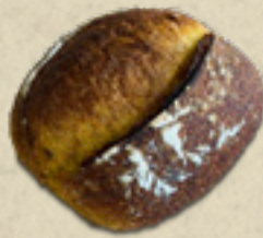
Abóbora _____ 20