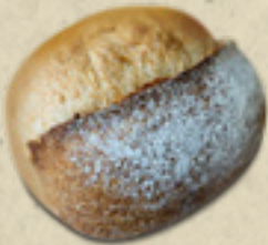
100% Invtegral _____ 20