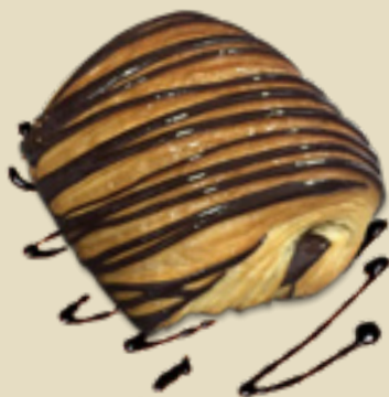
Pan au chocolat _____ 11