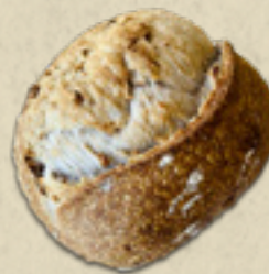
Nozes _____ 22