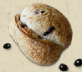
Azeitonas _____ 20,5