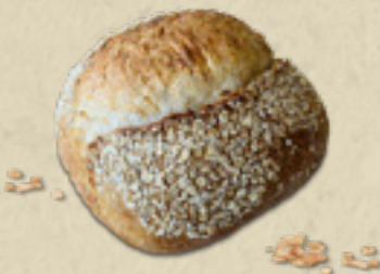
Aveia _____ 20