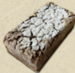
Alemão _____ 21,5