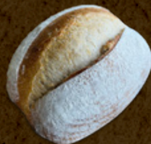
Rústico _____ 19,5