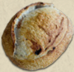
Nozes com passas _____ 24