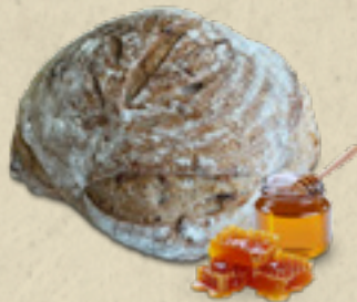
Nozes com mel _____ 22