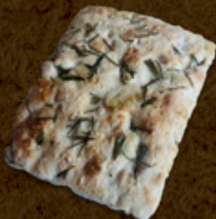
Focaccia alecrim ou tomate _____ 37/kg