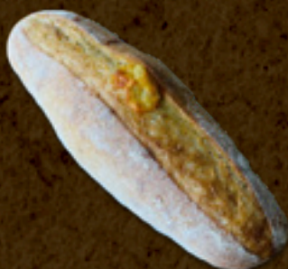
Filão de parmesão _____ 18