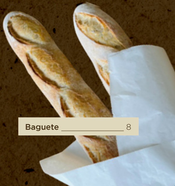
Baguete _____ 8