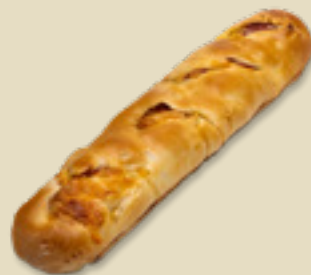
Tortano _____ 22